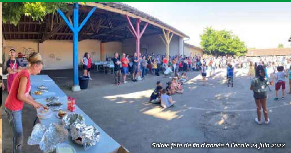
Soirée fête de fin d'année à l'école 24 juin 2022

L'association des parents d'élèves de l'école Cécile COUPAYE d'Estang continue d'œuvrer pour cette nouvelle année scolaire dans le but de récolter des fonds, afin de financer différents projets en faveur des enfants, en collaboration avec l'équipe pédagogique.