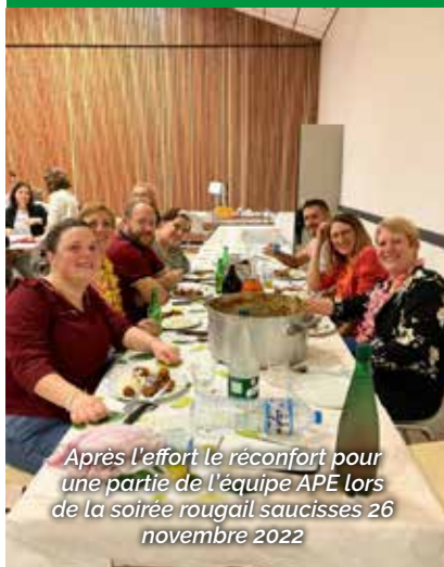
Après l'effort le réconfort pour une partie de l'équipe APE lors de la soirée rougail saucisses 26 novembre 2022